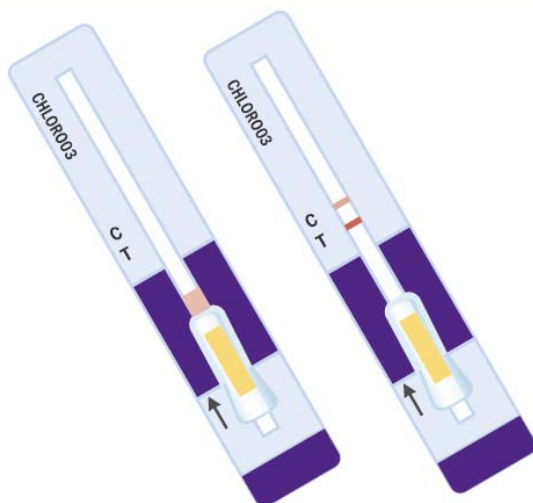
Charm Chloramphenicol Test Strips

Rychlý test určený ke stanovení MRPL* Chloramphenicolu v mléce